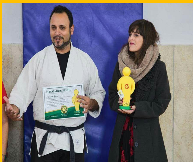
2017, Palermo Ricevimento titolo "Ambasciatrice del sorriso"