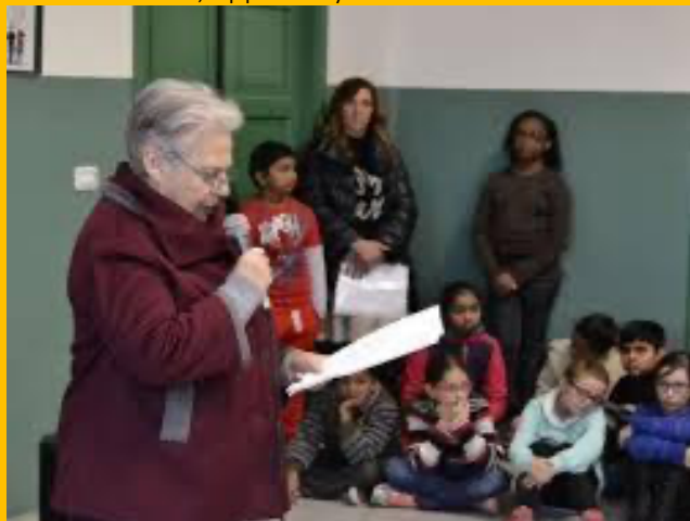
2010, Palermo Rita Borsellino, appello Aylan