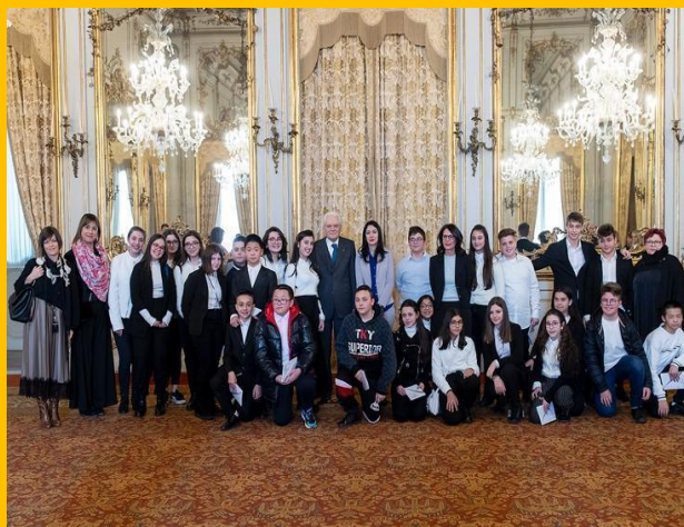
2019, Roma Presidente della Repubblica Sergio Mattarella Ministro Istruzione Lucia Azzolina