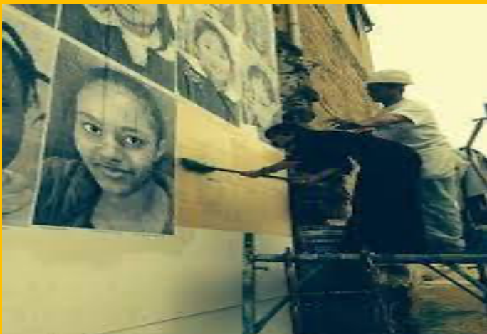
2014, Piazza Magione Istallazione Insideout Project