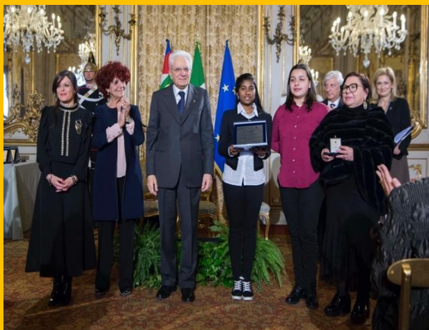
2017, Roma Presidente della Repubblica Sergio Mattarella Ministro Istruzione Valeria Fedeli